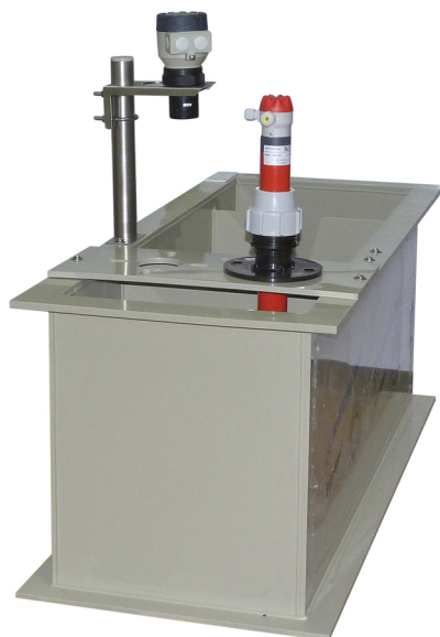
Equipos de medición instalados en DEBITBAC