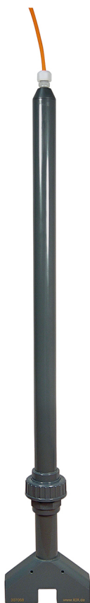
TURBISWITCH CP2 ZR