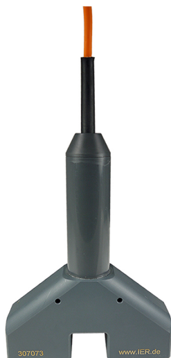
TURBISWITCH CP2 Z0