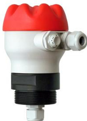
Cabezal de conexión BJSC con ventilación integrada (opcional)