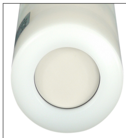
Vista inferior de la membrana cerámica