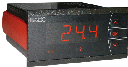
Indicador digital ITU (Opción)