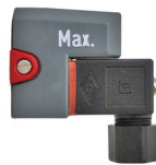
Contacto Z42 / Z40

Conformidad CE: El dispositivo cumple con las exigencias legales de las Directivas Europeas en vigor.