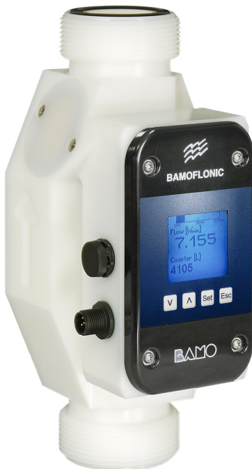
Modelo PEAD (DN32 a 50)